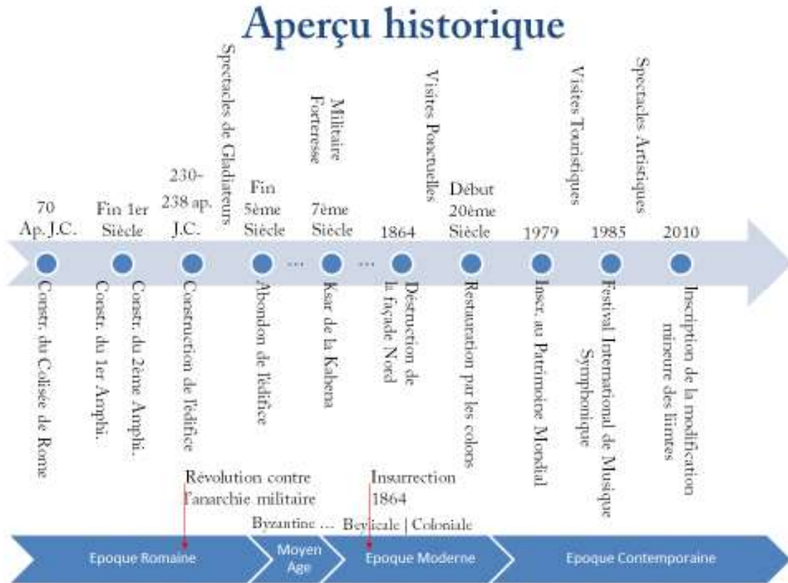
Figure 1. Echelle historique traçant les événements majeurs subis par l’amphithéâtre d’El Jem.