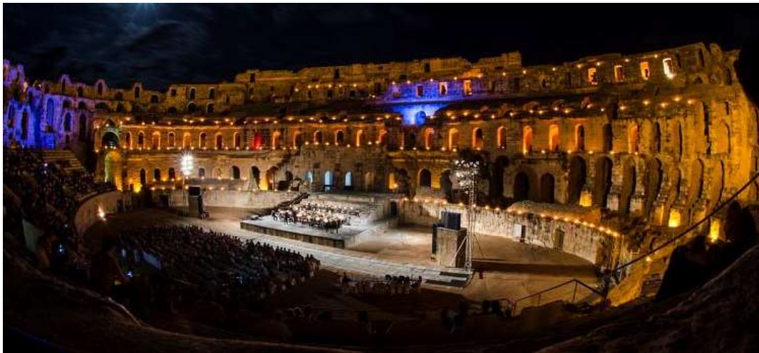
Figure 4. Photographie d'un spectacle musical à l'arène de l'amphithéâtre d'El Jem.